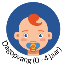
Dagopvang (0-4 jaar)

Pedagogisch beroepskrachten zijn erop gericht het dagprogramma af te stemmen op de specifieke doelgroep.