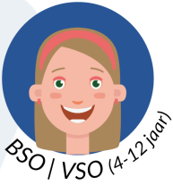
BSO | VSO (4-12 jaar)

Thema's op de peutergroepen worden afgestemd met de school om zo een doorgaande ontwikkelingslijn te creëren die gericht is op de cognitieve-, sociaal-emotionele-, motorische en sensorische ontwikkeling.